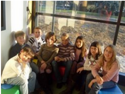
Les tchateurs et toute leur bande