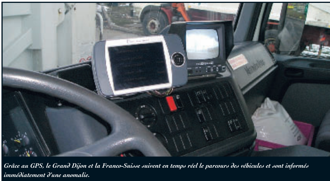
Grâce au GPS, le Grand Dijon et la Franco-Suisse suivent en temps réel le parcours des véhicules et sont informés immédiatement d'une anomalie.

La collecte terminée, le travail de la Franco-Suisse se poursuit avec l'acheminement des ordures non recyclables à l'usine d'incinération. Le contenant des bacs gris est brûlé. Quant au verre, il est vidé dans une fosse spéciale, avant d'être pris en charge par Saint-Gobain qui le fera fondre à très